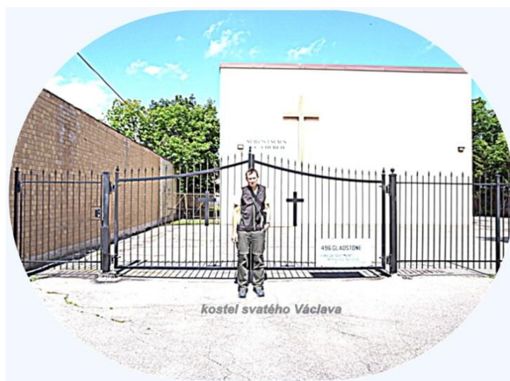
Kostel svatého Václava